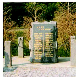
Monument de Temple de Bretagne en l'honneur du 3 ème bataillon du 67 ème RI

A la suite de cette reddition, le bataillon resta en faction encore quelques jours dans les villages afin d'empêcher le retour des habitants dans un secteur en cours de déminage. Il fut par la suite affecté à la garde d'un camp de 3.500 prisonniers allemands à Saint-Gildas-des-Bois, puis à la garde de la base militaire allemande de Sainte-Marguerite (près de La Baule).