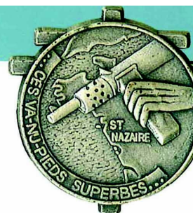
Médaille des «va-nu-pieds» du 67 ème

Vers la fin du mois de septembre 1944, le grand nombre d'engagés volontaires dans les rangs du 67 ème RI reconstitué imposa la formation d'un second bataillon. Ce dernier prit le nom de «2 ème Bataillon de Marche» avant de devenir le «3 ème Bataillon» lorsque fut créé un nouveau 2 ème Bataillon du 67 ème RI en Loire Atlantique à l'automne 1944. Plusieurs Noyonnais combattirent dans ses rangs, dont un trouva la mort au combat.