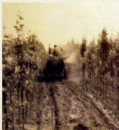
Pulvérisation pneumatique en 1954.

De part et d'autre de l'entrée, deux maisons de maître, l'une pour le directeur, l'autre pour le contremaître. Les bureaux s'ouvraient sur un grand hall à toits en terrasses destiné à l'entreposage des arbres avant leur chargement par le quai. Au fond de la cour, deux vastes bâtiments communiquant par un enclos renfermaient des écuries et des étables. Si la trentaine de chevaux étaient utilisés comme animaux de trait (charrue, charrettes), la centaine de vaches étaient utiles pour le fumier qu'elles produisaient. Ce dernier était transporté de manière mécanique par un monorail. Non loin de là, des entrepôts étaient encadrés par la maison des palefreniers et celle des vachers. Derrière la maison du directeur, un parc planté des essences produites à Noyon, donnait à voir au visiteur les arbres. Les travaux de construction de la ferme furent achevés en 1932.