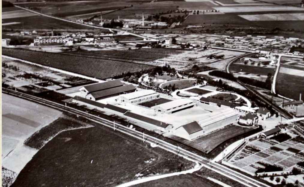
La ferme de la Croix Saint-Claude vue d'avion.