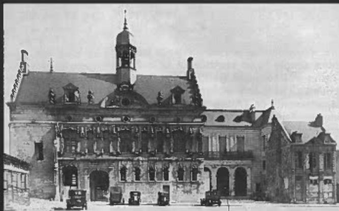
4. 1933 (photographie E. Campiagne, vers 1933 - collection musées de Noyon). Le 26 novembre 1932, malgré l'opposition du service des Monuments Historiques, la ville obtient que soient rayées de la liste de l'inventaire supplémentaire des Monuments Historiques les maisons accolées à l'hôtel de ville. Elles sont aussitôt détruites. Le pan nu de la façade Renaissance, qui avait vraisemblablement toujours reçu des constructions en retour, est découvert. L'extension au sud - cour d'honneur et bâtiment administratif de style néoclassique - est bientôt achevée. On projette de démolir la partie haute de la maison Poirer (aujourd'hui Office de tourisme), du nom de son dernier propriétaire, à droite de la cour d'honneur.