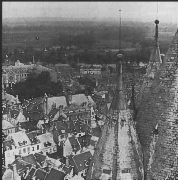
1. avant 1918 (vue depuis les tours de la cathédrale Notre-Dame, vers 1900). On distingue bien l'édifice du 16 ème siècle ensermé au nord et au sud par des constructions, aujourd'hui détruites, qui formaient un tissu urbain dense autour de l'hôtel de ville.