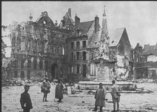
2. 1918 (photographie anonyme, datant de 1918). Le 26 mars 1918, l'artillerie française bombarde Noyon, à nouveau occupée par l'armée allemande. L'hôtel de ville est la proie des flammes durant plusieurs jours. Le corps principal de l'hôtel de ville est ruiné, et les maisons attenantes endommagées.

juin 1927). Cette extension fut abandonnée par le service des Monuments Historiques, puis les difficultés financières empêchèrent la réalisation de ce projet. 2. La destruction de ces maisons provoquera le déclassement de l'édifice Renaissance le 22