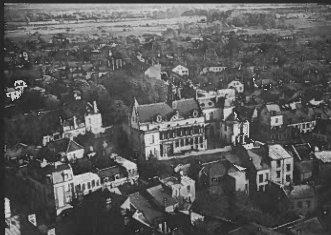
5. 1937 (Photographie Henri Anselmi, vers 1950 - collection musées de Noyon). Une "loge" en avant-corps est édifiée en 1934 pour masquer le pan nu de la façade