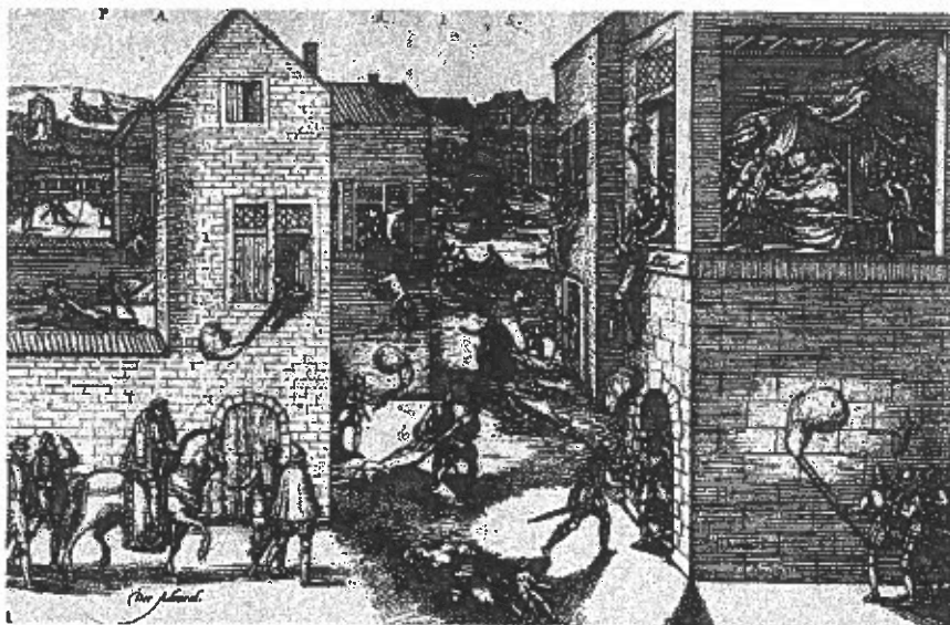
Le massacre de la Saint-Barthélémy le 24 août 1572.

Il y a deux ans, le musée Jean Calvin avait eu la chance d'acquérir une peinture allemande de la fin du XVI ème siècle, "La Mercuriale tenue aux Grands Augustins à Paris le 10 juin 1559". Cinq autres peintures appartenant au même ensemble que le tableau de Noyon avaient pu être identifiées dans les collections royales de Hampton Court en Grande-Bretagne. L'analyse précise des gravures du recueil allemand a montré qu'elles ont été utilisées en concurrence avec les gravures de Tortorel et Perrissin pour l'exécution des peintures. Le succès de ces dernières estampes et, certainement, la difficulté des amateurs pour se les procurer, ont pu inciter un éditeur allemand à commercialiser des copies meilleur marché, contribuant ainsi à la fortune des images genevoises. De même que les peintures, les gravures allemandes témoignent de l'intérêt porté outre-Rhin aux affaires intérieures du Royaume de France au XVI ème siècle. Davantage encore que les planches genevoises, les copies allemandes ont jusqu'à aujourd'hui été abondamment utilisées (pas toujours avec discernement) comme les seules illustrations d'événements majeurs de l'histoire de la France moderne.